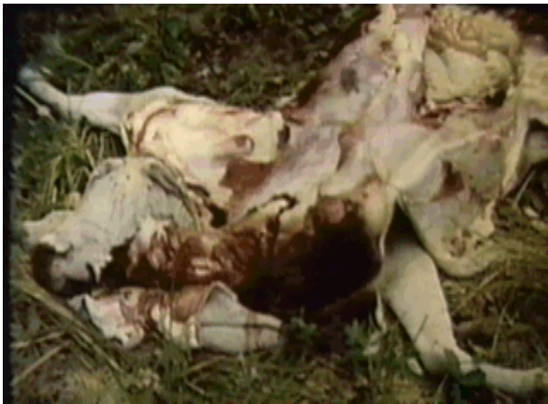
Figura 3- Necrópsia