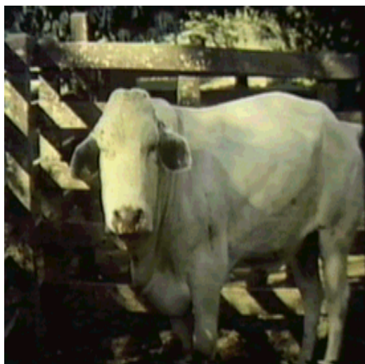
Figura 6- Bovino picado com edema na cabeça, pescoço e torax