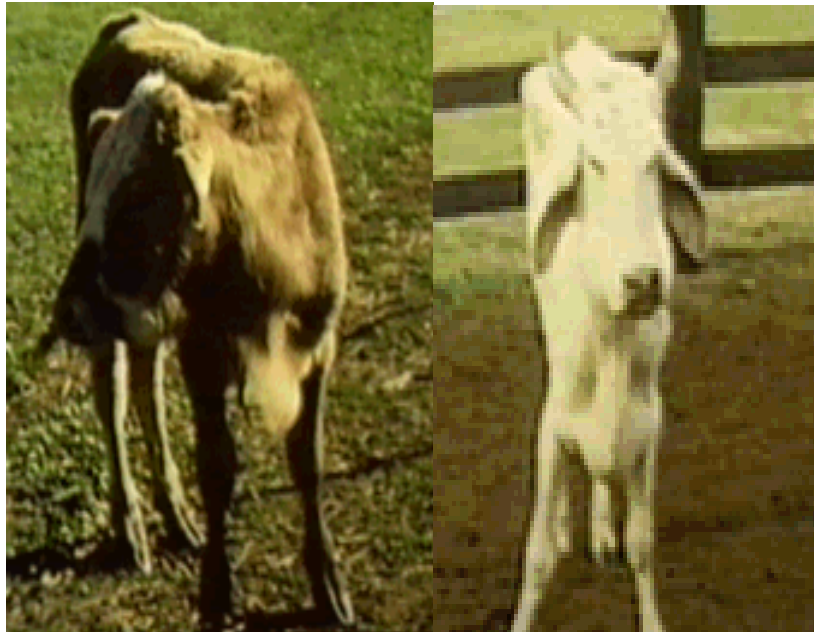
Figura 5- Edema de pescoço e torax