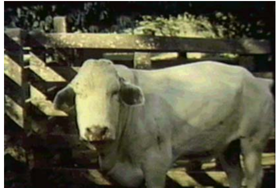
Figura 2- Edema volumoso