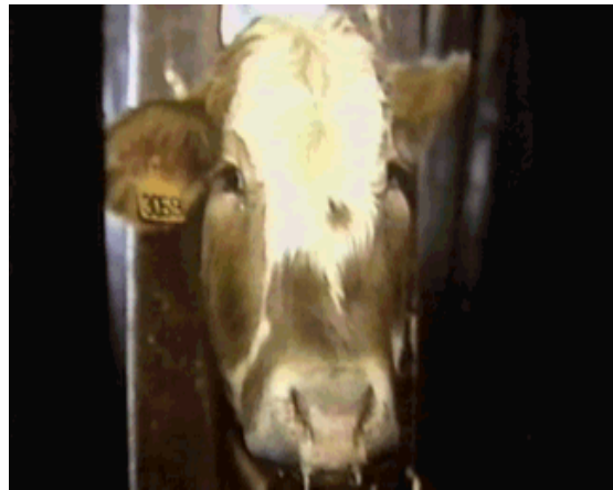
Figura 4- Picada na região da cabeça