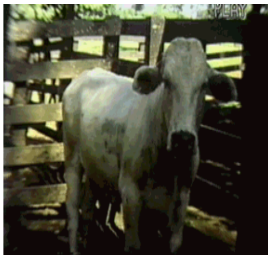
Figura 7- O mesmo bovino após 72 horas após a medicação